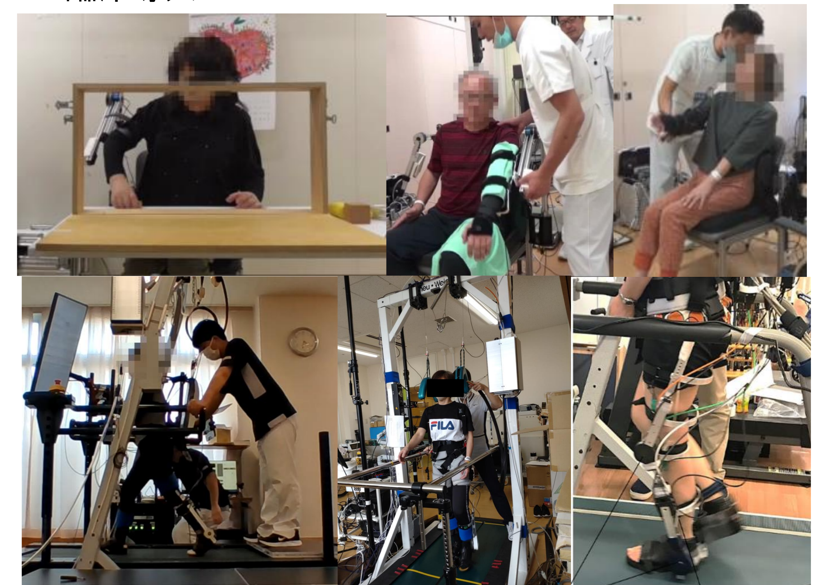
■ インターフェース基盤 ■ リアルタイムシステムのアーキテクチャ