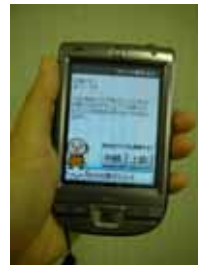
PDAのコンテンツ表示