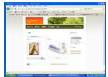
Webのオーサリングツール