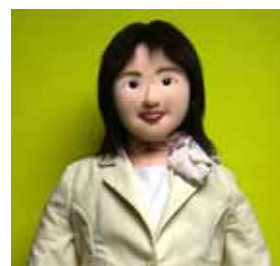
ぬいぐるみ本体完成