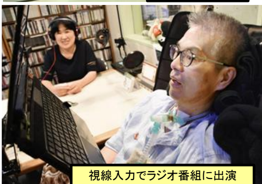
視線入力でラジオ番組に出演