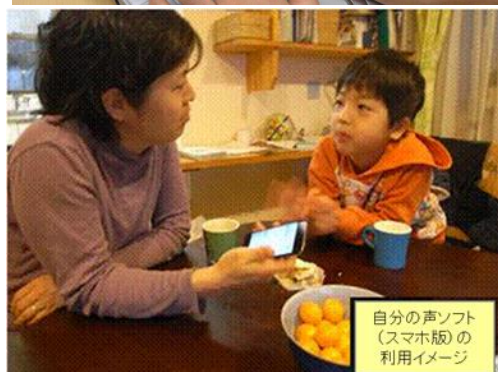
自分の声ソフト (スマホ版) の 利用イメージ