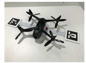
遠隔操作用 AR マーカー (下から見た様子)