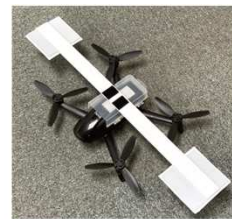
小型ドローン (Parrot 社製 BEOP2)