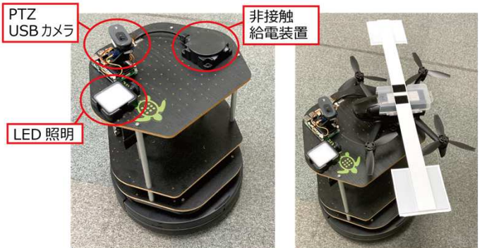
車輪型移動ロボット (Yujin Robot 社製 Kobuki)